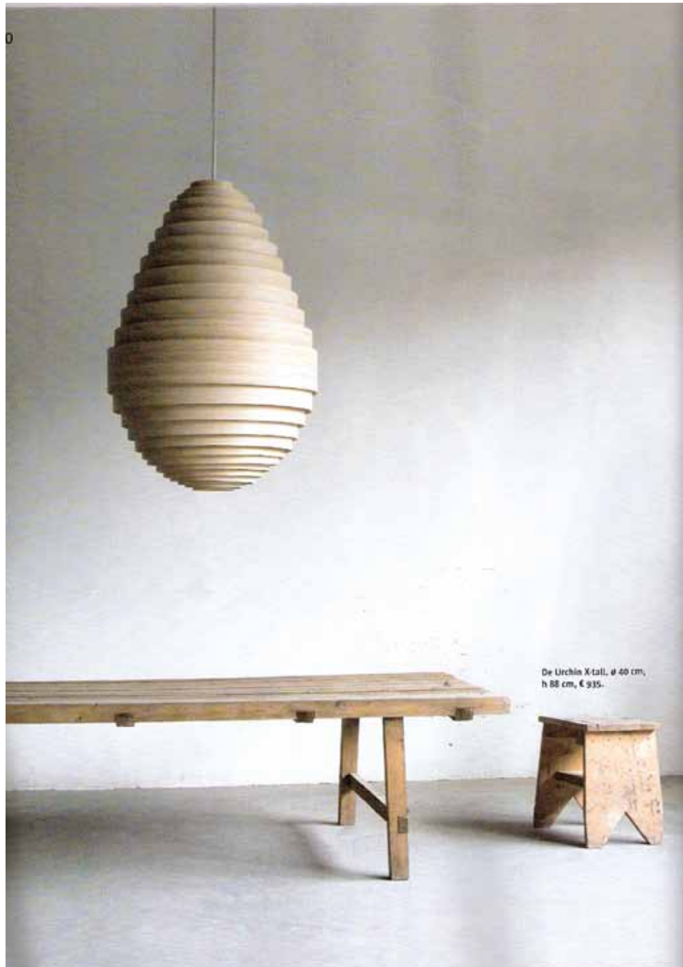
De Urchin X-tall. ø 40 cm, h 88 cm, € 935.